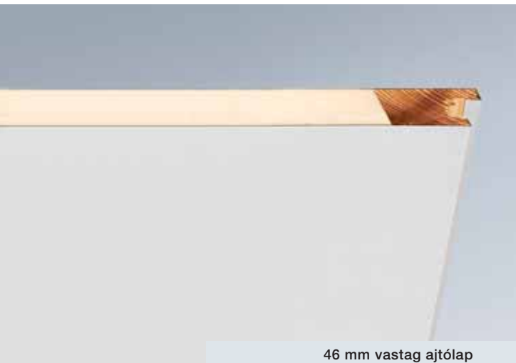
46 mm vastag ajtólap