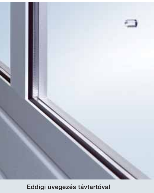
Eddigi üvegezés távtartóval