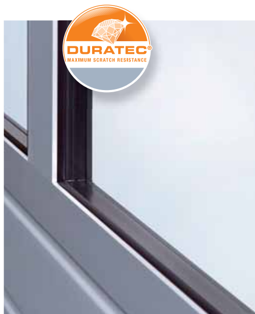
Új 26 mm vastag üvegezés