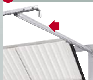
2 Biztos sínvezetés

A kapulap kisiklását a precíz sínvezetés akadályozza meg.