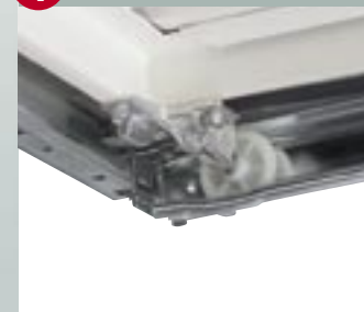
4 Végállás biztosítás

Felsővégállás biztosítással a kapu biztonságosan nyugalmi állapotba kerül.